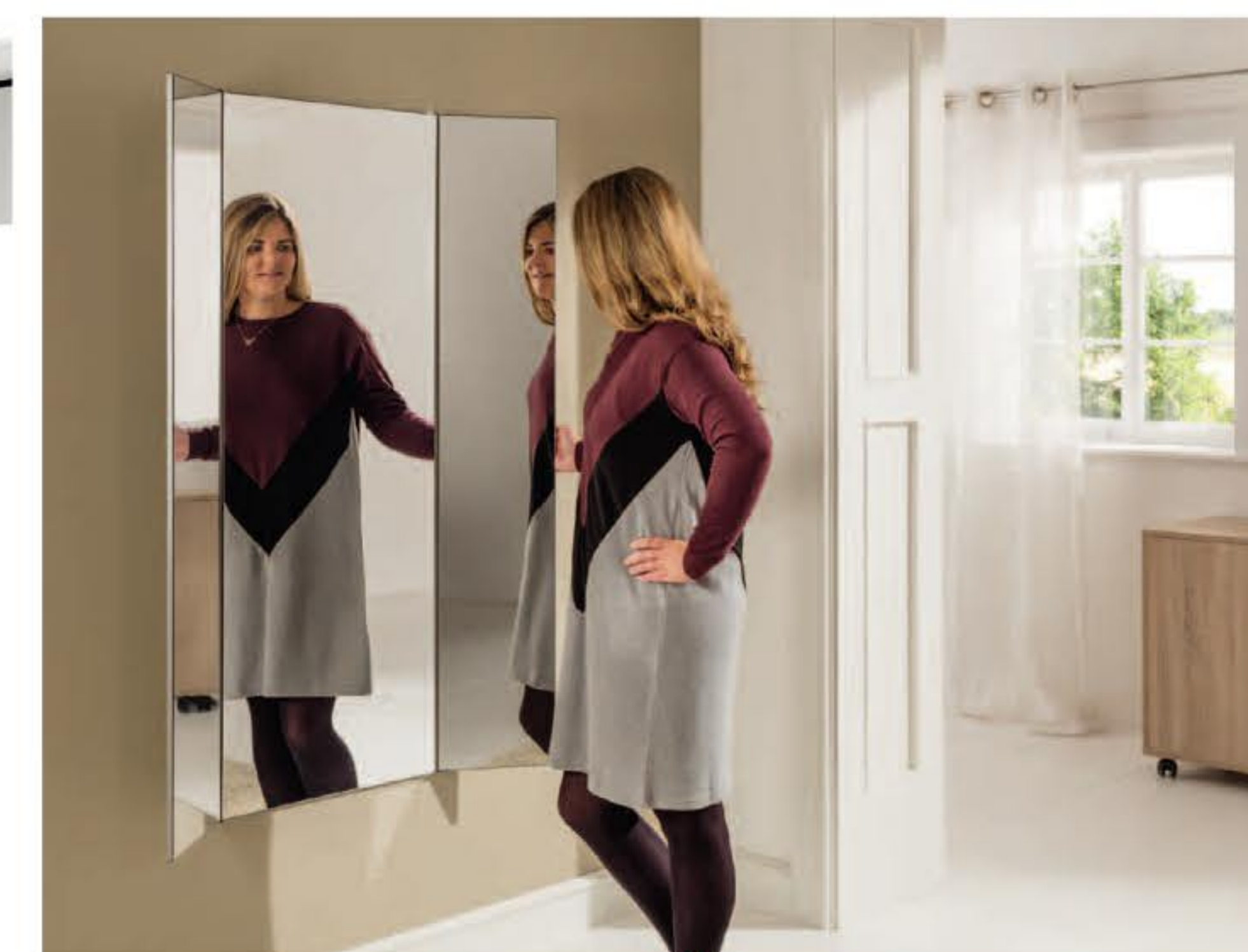
DRESSER | Nähen - Anprobieren - Rundum sehen DRESSER | Sew - try on - admire DRESSER | coudre - essayer - vision 3D