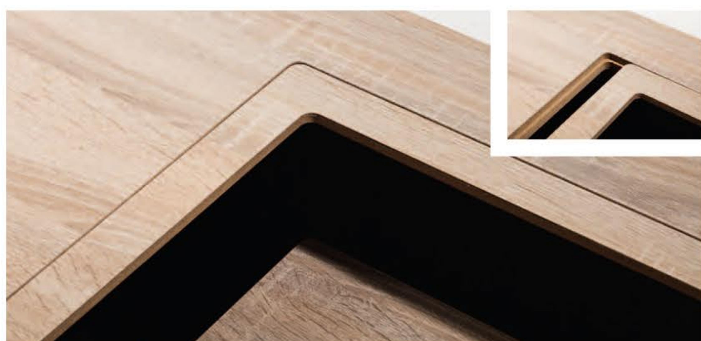
Ausfüll-Rahmen in MDF-Holz Filling frame in MDF wood Cadre de remplissage en bois MDF