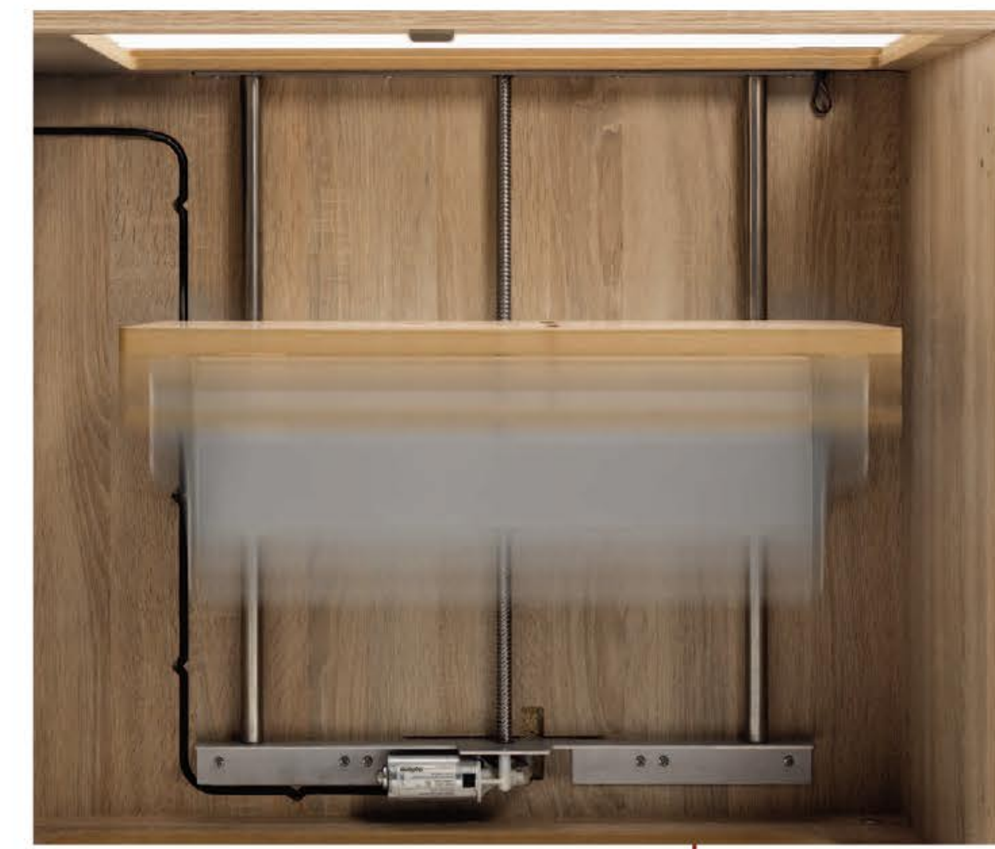
RMF - easy-Softtech Lift, die Verfahrenheit RMF - easy-Softtech Lift, the moving unit L'ascenseur RMF - easy-Softtech, unité de conduite