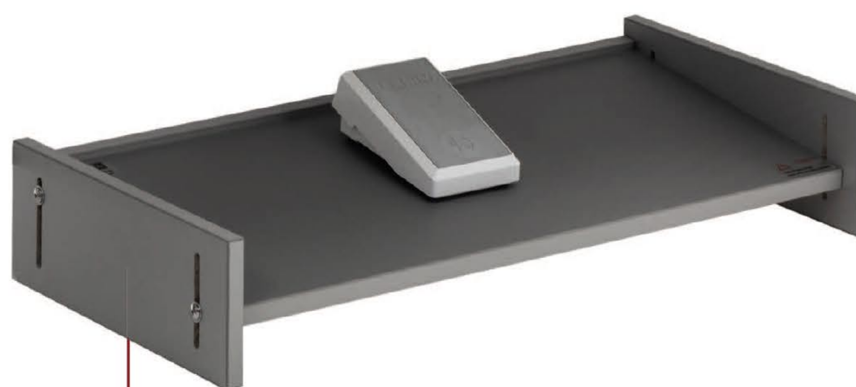
Ergonomische Fuß-, und Pedalauflage Ergonomic foot and pedal support Repose-pied ergonomique et support de pédale