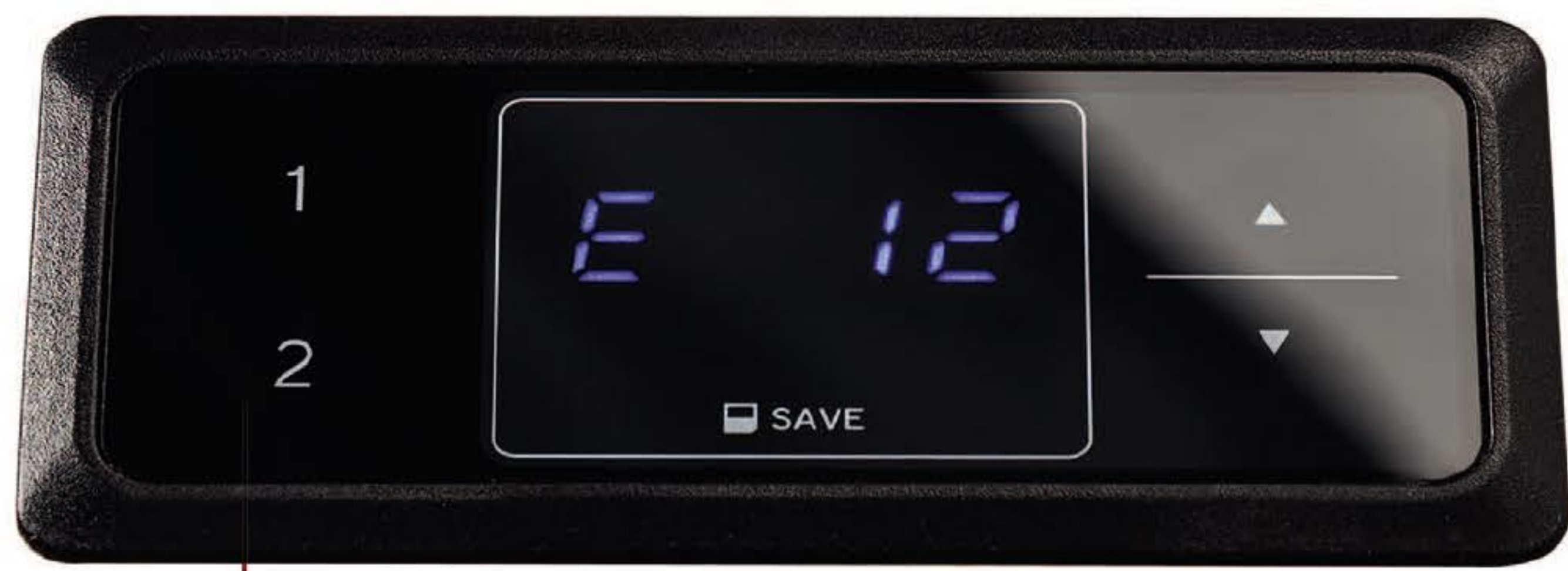
i-Touch Bedienfeld für RMF - easy-Softtech Lift i-Touch control panel for RMF - easy-Softtech Lift i-Touch tactile pour l'ascenseur RMF - easy-Softtech