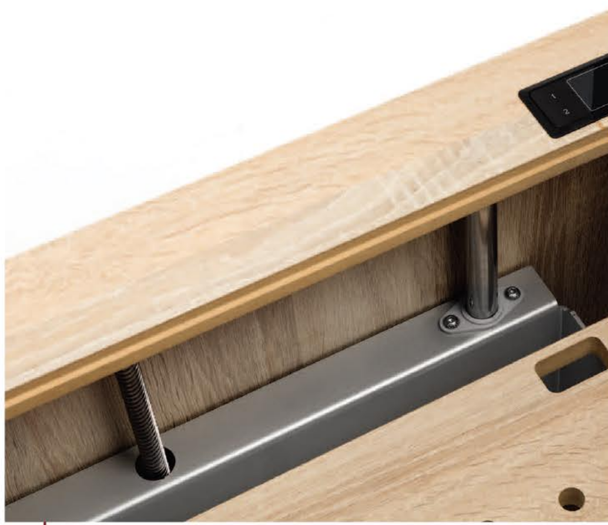
RMF - easy-Softtech Lift, die Spindel RMF - easy-Softtech Lift, lead spindel L'ascenseur RMF - easy-Softtech, la broche